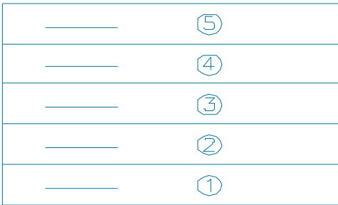
图 5.1.2-1 整体分层连续浇筑施工

5.1.2 大体积混凝土工程的施工宜采用整体分层连续浇筑施工(图5.1.2-1)或推移式连续浇筑施工(图5.1.2-2)。